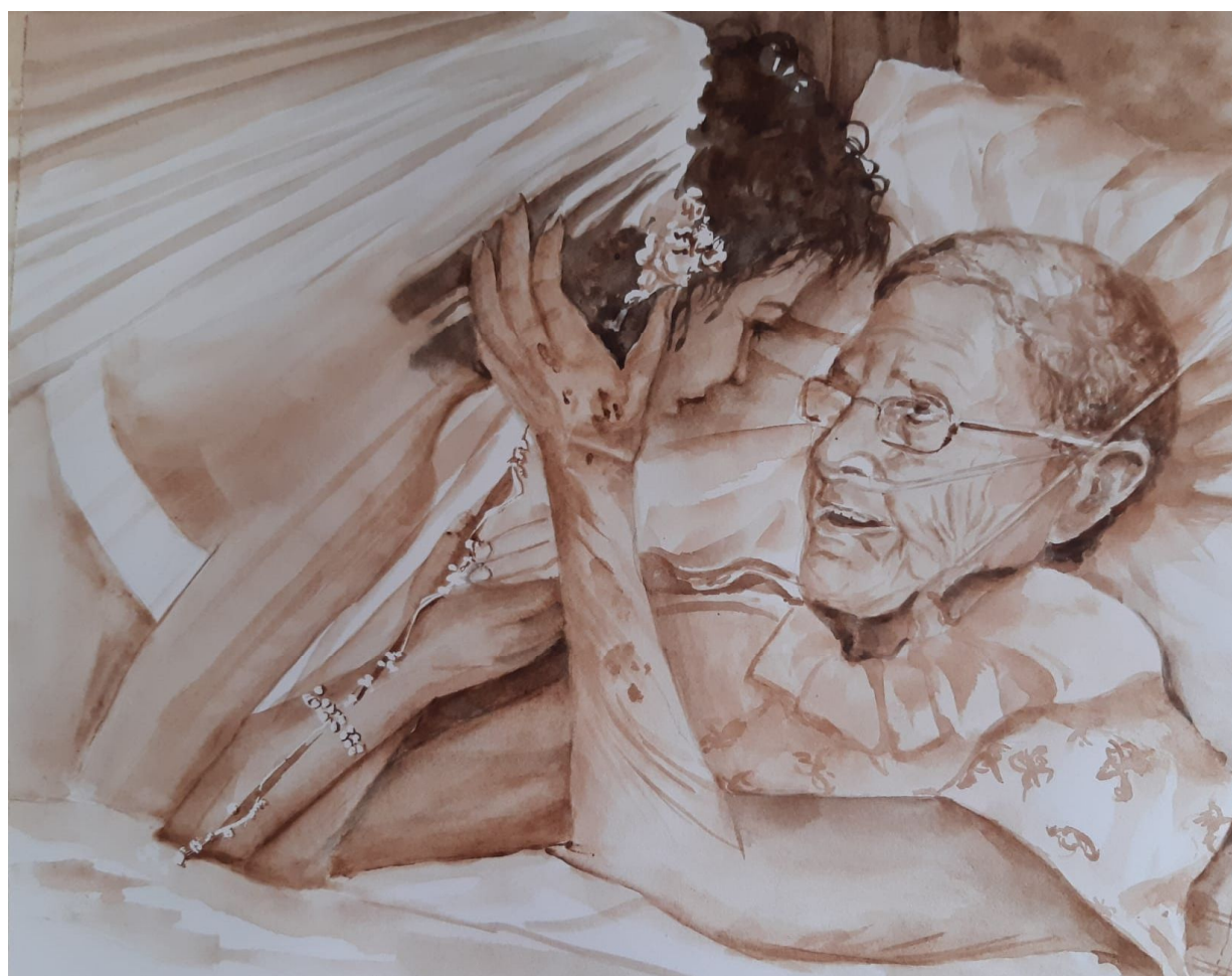
Nel giorno più bello – Misura 25 x 35 cm – Tecnica acquarello monocromatico