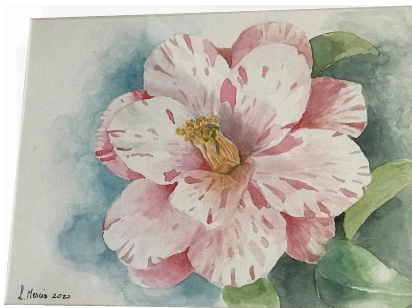
Bellezza mozzafiato – Misura 51 x 44 cm – Tecnica acquarello