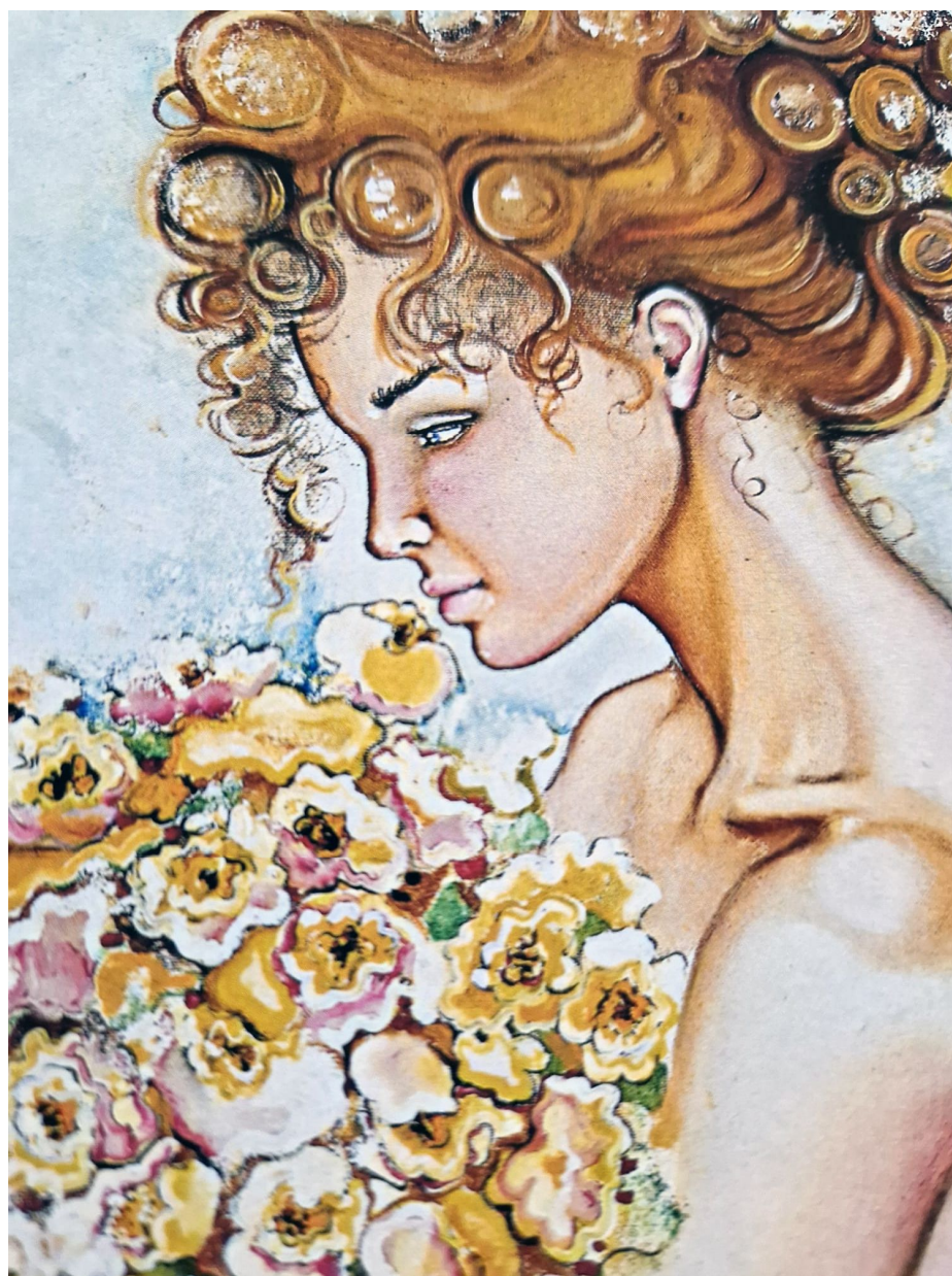
Dolce Fanciulla – Misura 50 x 70 cm – Tecnica olio su tela

E' così che con entusiasmo e passione guida la penna come fosse un pennello per esprimere sentimenti ed emozioni.