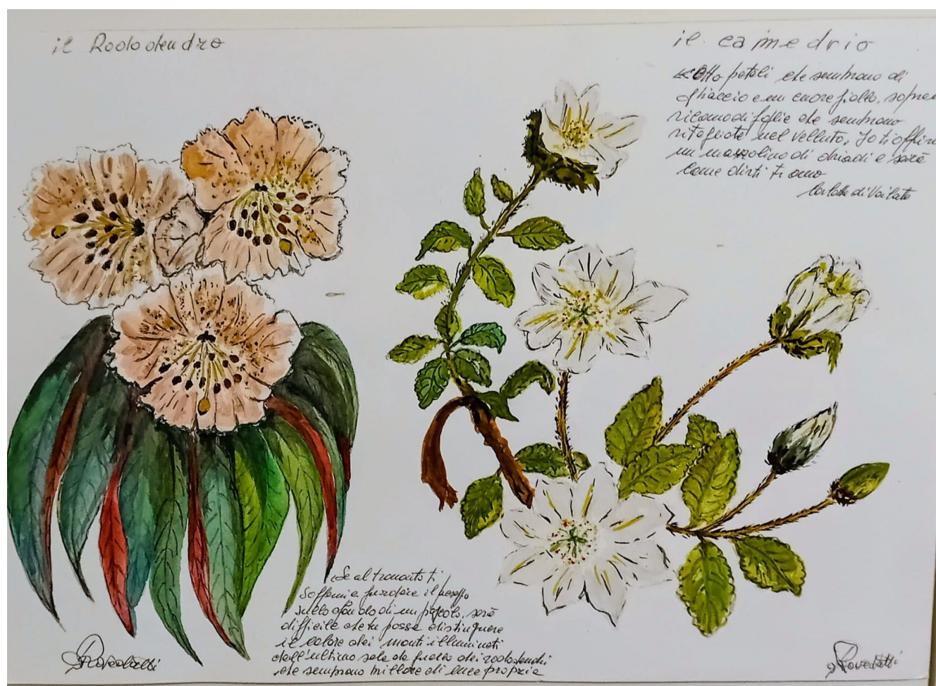
Fiori di montagna – Misura 20 x 30 cm – Tecnica acquerello