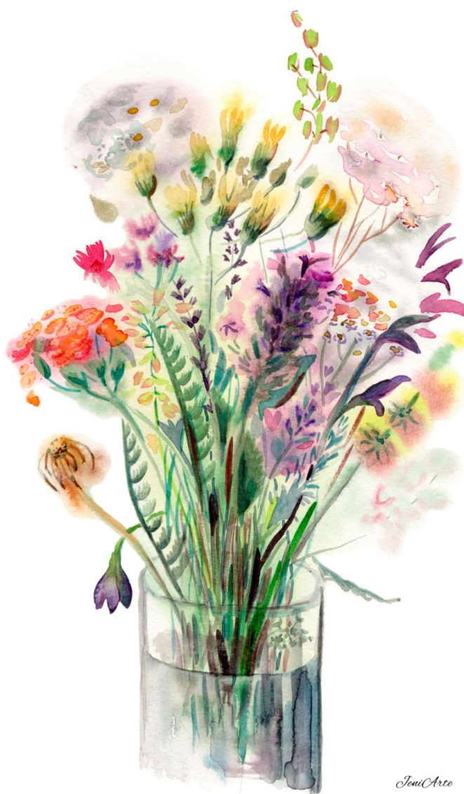
Il dono più prezioso – Misura 20 x 36 cm – Tecnica acquarello

La seconda opera è un fiore caratterizzato da trasparenza, leggerezza e tonalità morbide. Nei suoi petali sottili e nella luce che li attraversa riconosce la delicatezza e la sensibilità che considera parte essenziale della gentilezza. La fragilità apparente diventa, in realtà, una forma di forza silenziosa.