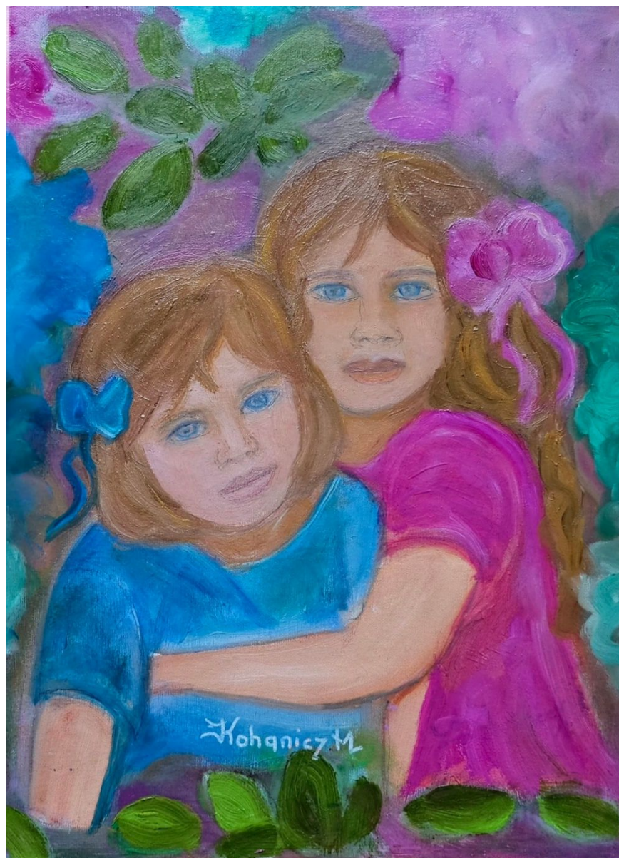
Le sorelline – Misura 40 x 50 cm – Tecnica olio su tela

Sono nata in Ungheria ... sono arrivata in Italia sposando con un italiano. Disegno e dipingo da piccola, da quando riuscivo tenere in mano una matita ... Ho dipinto sui muri, legno, seta, porcellana ... poi olio su tela. Dipingo paesaggi, fiori, persone, soprattutto ritratti ... da fotografia. Amo i colori dei fiori, del cielo, mare, montagna. perché chi ama la natura trova ovunque la bellezza, Ed io la amo!