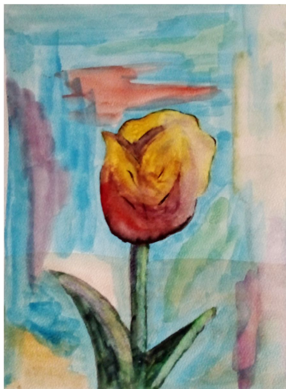
Il ricordo di un tulipano – Misura 21 x 30 cm – Tecnica acquarello

Una dedica al mio pensiero che ricorda nel tempo una gentilezza volata via, ascoltarla è un dono che ci accompagna nei nostri cuori turbati, bisognosi di sospirate carezze, e poi quelle poche parole giungono nella ricerca di una gentilezza tutta da scoprire. Ecco il nutrimento che ci porta via col vento.