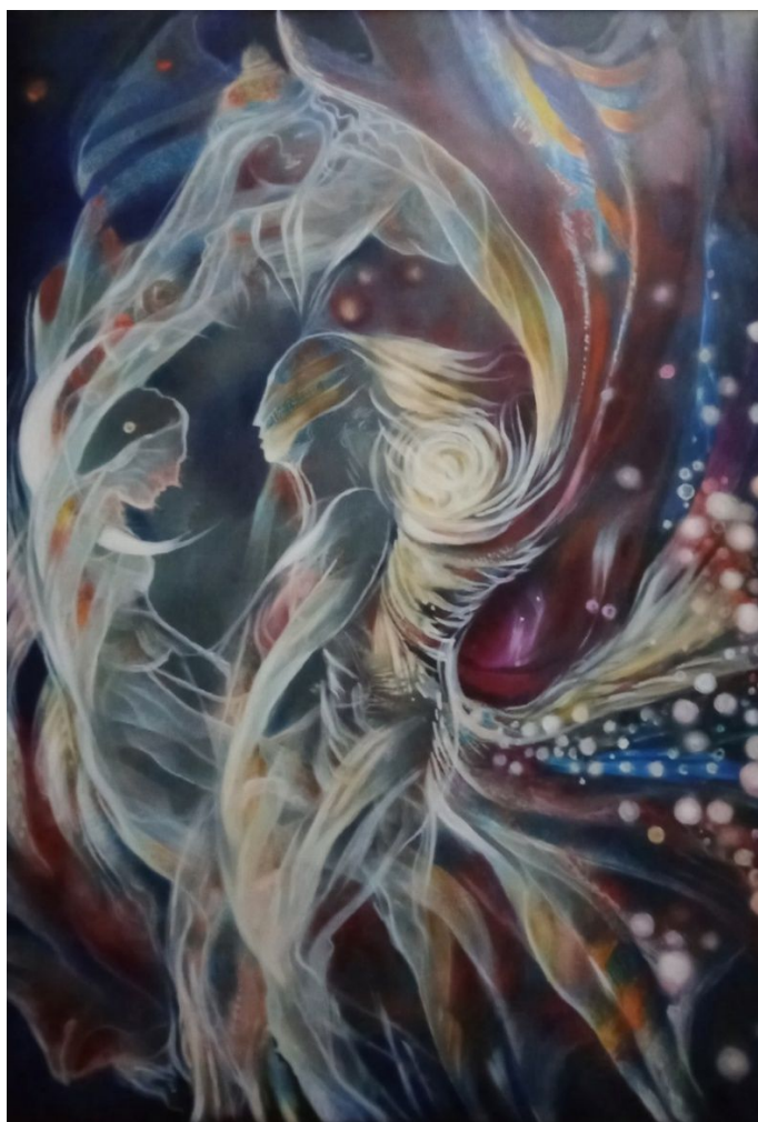
Eterni innamorati – Misura 50 x 70 cm – Tecnica acrilico su tela