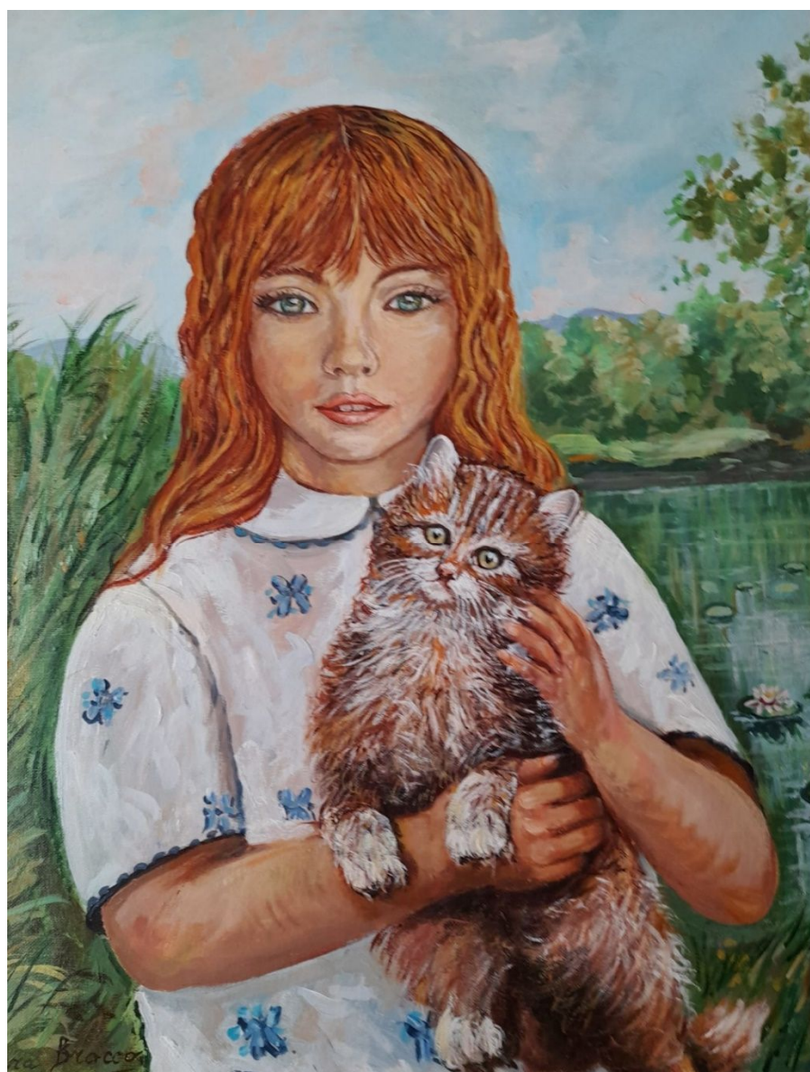
Amici – Misura 40 x 50 cm – Tecnica olio su tela

Ha partecipato a numerosi concorsi ed estemporanee, riscuotendo apprezzamenti.