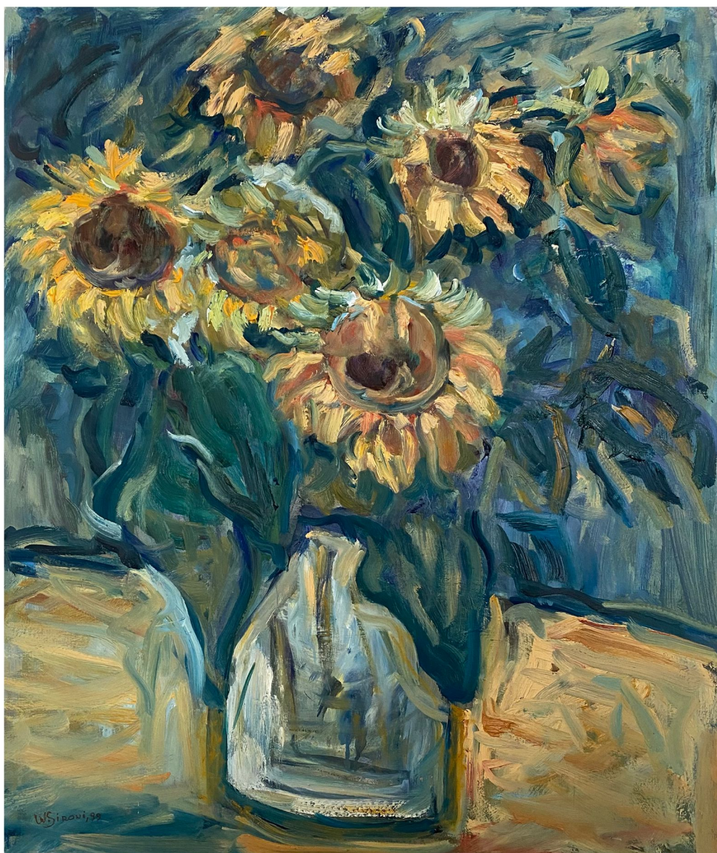
Girasoli – Misura 50 x60 cm – Tecnica olio su tela