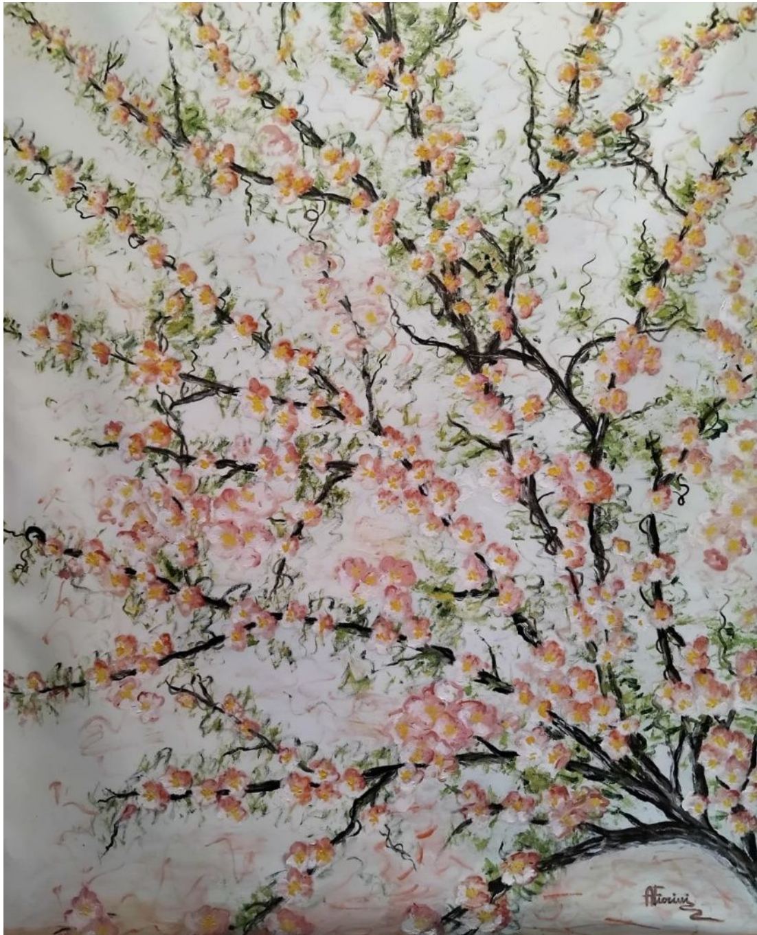
Primavera – misura 80 x 100 cm – Tecnica olio su tela