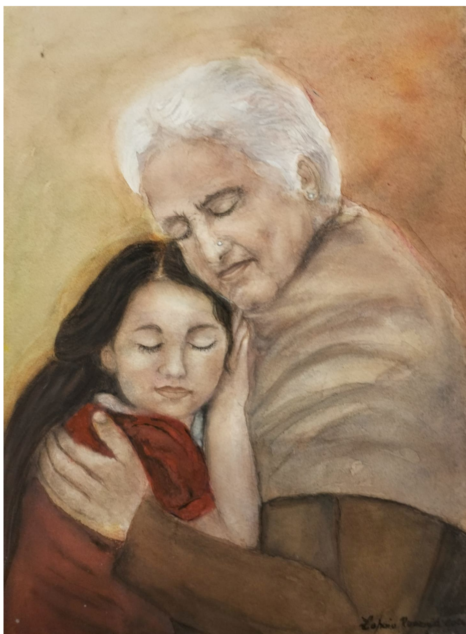
Sentimenti profondi – Misura 45 x 55 cm – Tecnica acquarello

Nata a Napoli si è trasferita in provincia di Milano nel 1975. Dipingere è sempre stata la sua maggiore aspirazione e, in cuor suo, avrebbe voluto approfondire frequentando l'Accademia per poter esprimere la sua creatività. La vita però l'ha portata a scelte diverse, quella dell'insegnamento presso la scuola materna per ben 38 anni. Solo dopo, con l'arrivo della pensione, si è potuta finalmente dedicare alla sua vera passione "la pittura" ed a quei colori che le ricordano la sua terra che in cuor suo non ha mai abbandonato. Attualmente frequenta la scuola di acquarello tenuta dall'insegnante Nadia Rosatti presso la sede del Gruppo Artistico Desiano. Ha partecipato a numerose mostre collettive organizzate dal GAD (Gruppo Artistico Desiano).