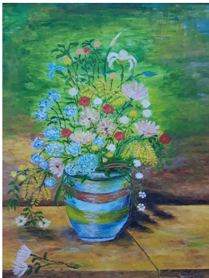
Danza floreale - Misura 40 x 50 cm - Tecnica mista