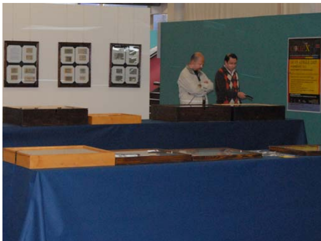
Il settore numismatico con alcuni soci collezionisti: che stiano parlando di monete?