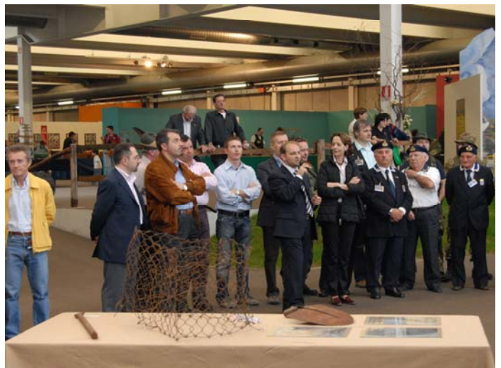
Un primo piano di reperti della prima guerra mondiale e sullo sfondo l'inaugurazione dell'evento alla presenza dei responsabili dei vari enti territoriali e delle associazioni partecipanti.